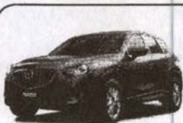
Mazda CX-5 2016

SI INVIERTES A PLAZO A TRAVES DE TU CUENTA UNICA, TENDRAS ACCESO A UNA LINEA DE PROTECCION PARA EMERGENCIAS DE HASTA EL 80% DEL MONTO DE TU INVERSION. PREGUNTA A TU EJECUTIVO.